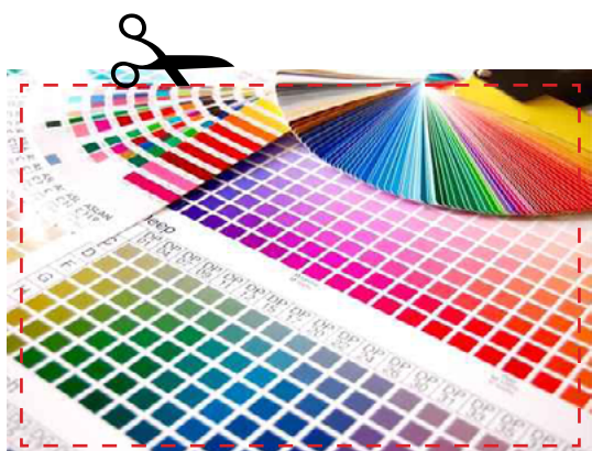
SI: Impaginato correttamente

Lasciare 2 mm per lato di abbondanza per rifilo finale.