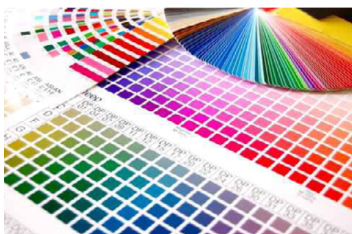
Finito, stampato e tagliato